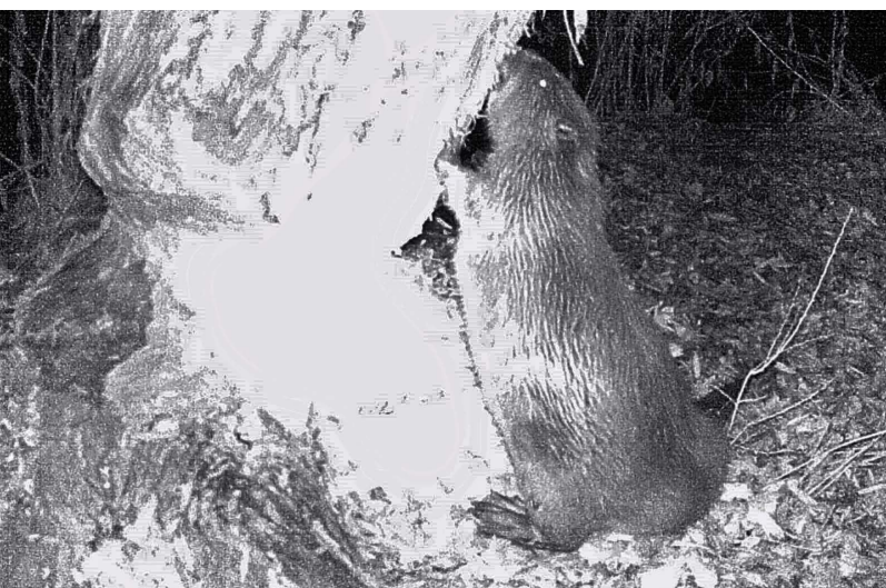
Abbildung 133: Biber beim Fällen eines Baumes am 25.11. mit einer Wildkamera aufgenommen.

deuteten Biberspuren im Ruhrbogen im Städtedreieck Duisburg, Mülheim an der Ruhr und Oberhausen hin. Aufgrund der räumlichen Distanz und der Frische der Nagespuren konnten sie nicht von dem Tier aus dem ruhraufwärts gelegenen Gebiet stammen.