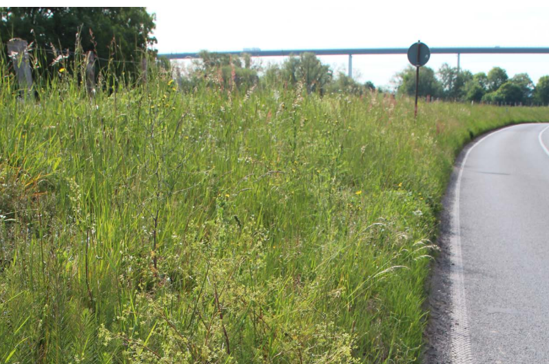
Abbildung 129: Hundskerbel am Fuße des Ruhrdeichs in Mülheim

Beim Hundskerbel handelt es sich um eine bislang noch seltene Ackerbegleit- und Ruderalpflanze. Im Jahr 2020 ergaben sich gleich mehrere Funde der Art im Vereinsgebiet der BSWR in der Rheinaue Binsheim, in der Rheinaue Ehingen und am Fuße des Saarner Deichs in Mülheim an der Ruhr (Abbildung 129). Bis auf das Vorkommen in Ehingen standen die Pflanzen nicht in Äckern selber, sondern an Wegrändern und Säumen. Der Hundskerbel gilt als wärmeliebend, sein Verbreitungsschwerpunkt reicht vom Mittelmeerraum bis Mitteleuropa und er gilt in NRW als Neophyt. Möglicherweise breitet sich die Art aktuell durch die warmen, trockenen Sommer aus, was in den kommenden Jahren zu verfolgen sein wird. Bei dem Fund am Saarner Deich ist zu erwähnen, dass sich das Vorkommen knapp im Süderbergland befindet. Für die-