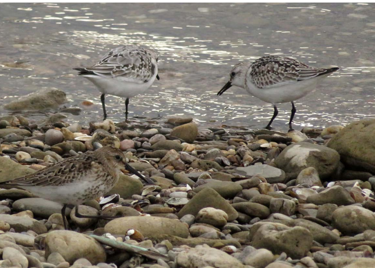
Abbildung 134: Die beiden Sanderlinge und einer der acht Alpenstrandläufer am Rheinufer bei DU-Mündelheim am 27.09.

Essener Ruhrtal wurde erneut ein territoriales Männchen gefunden. Vom 05.05. bis 08.06 hielt es in der Mülheimer Ruhraue ein Revier besetzt und konnte auch beringt werden (Abbildung 135). Eine Überraschung war ein balzendes Paar Löffler an der Graureiherkolonie im Heisinger Bogen (Essen), das jedoch noch am gleichen Tag abends weiterzog. Sehr ungewöhnlich war zudem der Fund eines geschwächten Sperlingskauzes am 25.03. in Essen-Altenessen, der vermittelt durch die UNB Essen zur Pflege in eine Auffangstation gebracht werden konnte. Am 22.09. wurde ein totes Tüpfelsumpfhuhn an der Bergsenkung im Köllnischen Wald gefunden (C. Mollmann). Es war in einem so guten Zustand, dass es zur Präparation dem LWL-Museum für Naturkunde in Münster übergeben wurde.