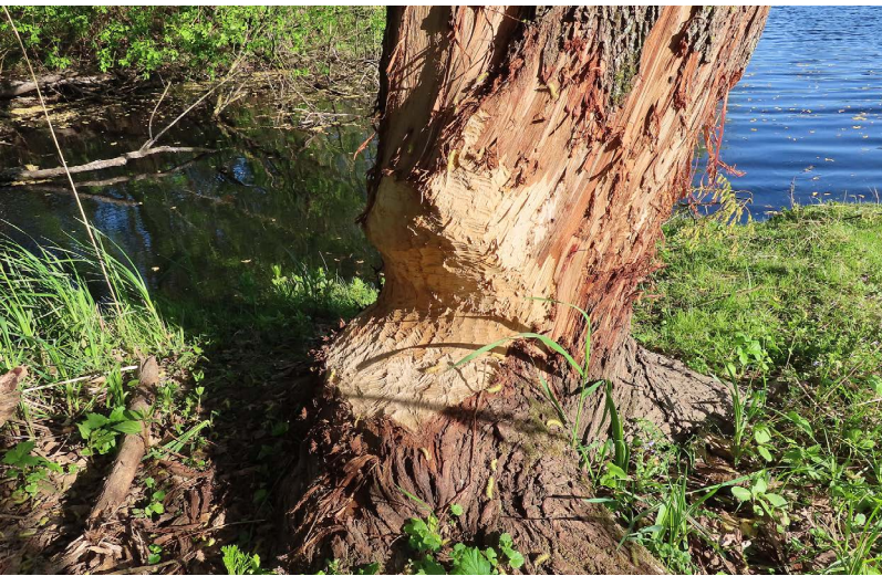
Abbildung 132: Biberfraßspuren in der Ruhraue am 20.04.

deuteten Biberspuren im Ruhrbogen im Städtedreieck Duisburg, Mülheim an der Ruhr und Oberhausen hin. Aufgrund der räumlichen Distanz und der Frische der Nagespuren konnten sie nicht von dem Tier aus dem ruhraufwärts gelegenen Gebiet stammen.