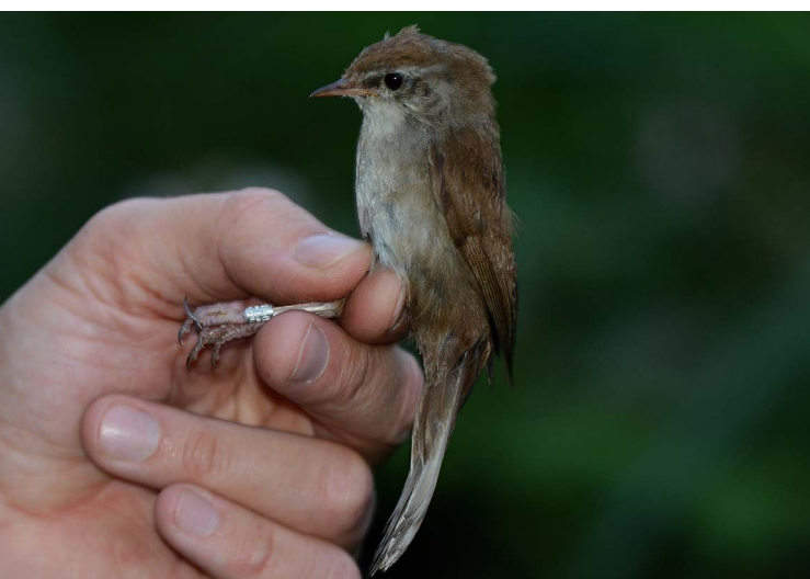
Abbildung 135: Der Seidensänger in der Ruhraue in Mülheim am 08.06.

Essener Ruhrtal wurde erneut ein territoriales Männchen gefunden. Vom 05.05. bis 08.06 hielt es in der Mülheimer Ruhraue ein Revier besetzt und konnte auch beringt werden (Abbildung 135). Eine Überraschung war ein balzendes Paar Löffler an der Graureiherkolonie im Heisinger Bogen (Essen), das jedoch noch am gleichen Tag abends weiterzog. Sehr ungewöhnlich war zudem der Fund eines geschwächten Sperlingskauzes am 25.03. in Essen-Altenessen, der vermittelt durch die UNB Essen zur Pflege in eine Auffangstation gebracht werden konnte. Am 22.09. wurde ein totes Tüpfelsumpfhuhn an der Bergsenkung im Köllnischen Wald gefunden (C. Mollmann). Es war in einem so guten Zustand, dass es zur Präparation dem LWL-Museum für Naturkunde in Münster übergeben wurde.