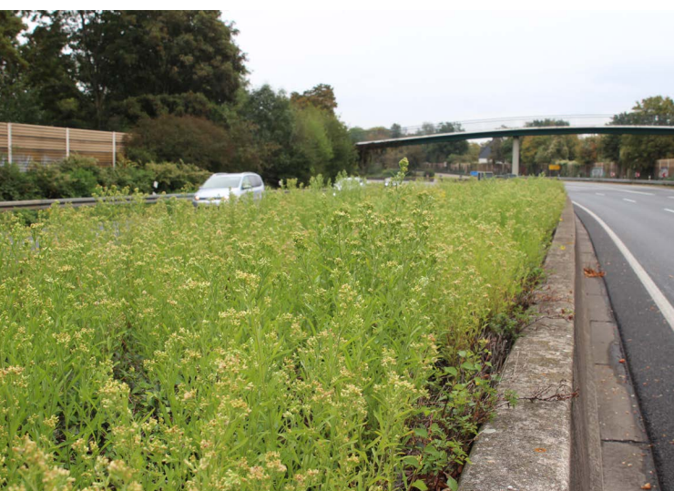
Abbildung 131: Das Weiße Berufkraut auf der im September nach einem Unfall gesperrten A40 am Kreuz Kaiserberg

Bis auf einzelne Fundmeldungen (vgl. z. B. Bochumer Botanischer Verein 2019, 2020) blieb die Art offenbar bis zum Jahr 2020 im Ruhrgebiet unentdeckt. Einmal im Bewusstsein tauchte sie jedoch plötzlich im Herbst 2020 – zumindest im Ruhrgebiet – an nahezu jeder Straßenecke auf. Da es unwahrscheinlich ist,