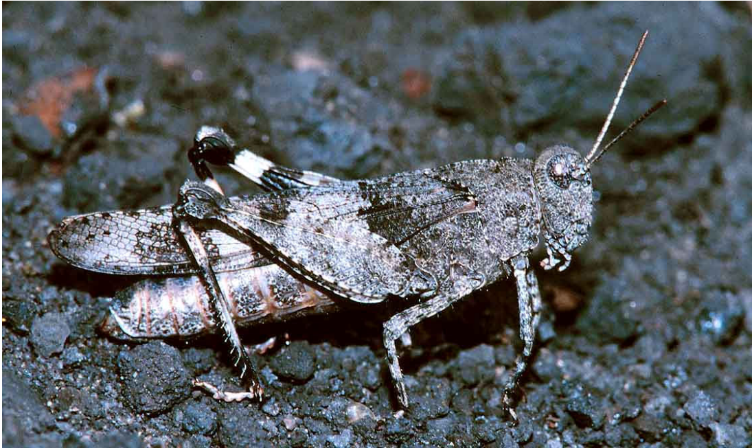
Abb. 4: Blaüflügelige Ödlandschrecke ( Oedipoda caerulescens ).

die dortige Spinnenfauna. Bereits im Jahre 1998 konnte sie dann auch auf dem Gelände der Zeche Zollverein in Essen gefunden. Die Art dürfte mittlerweile im gesamten westlichen Ruhrgebiet weit verbreitet sein, während sie sich weiter östlich nicht mehr so stark auszubreiten scheint.