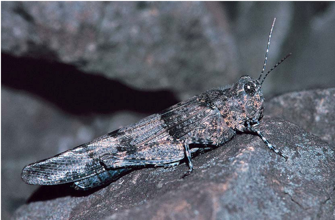
Abb. 5: Blauflügelige Sandschrecke ( Sphingonotus caerulans ).

falt. Die Erfassung der genaueren Aus- und Verbreitung besonders sich neu etablierender Heuschreckenarten sollte dabei ein Schwerpunkt zukünftiger faunistischer Untersuchungen im Ruhrgebiet sein.