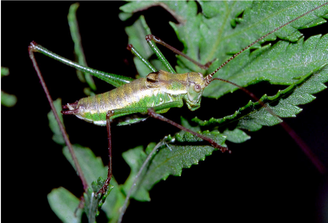
Abb. 2: Gestreifte Zartschrecke ( Leptophyes albovittata ).