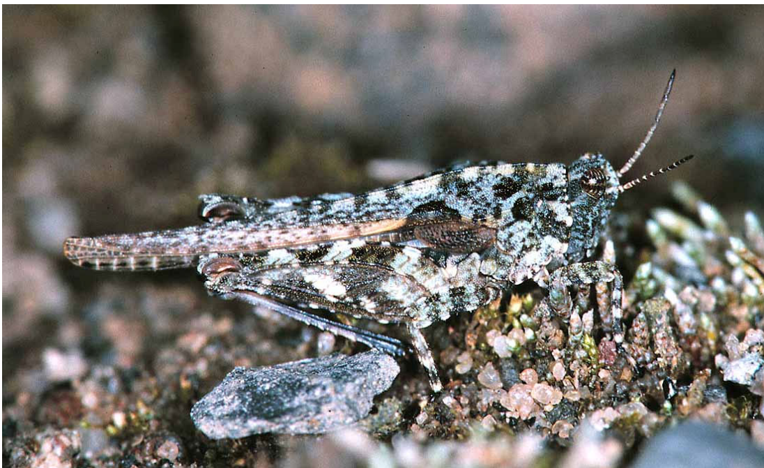
Abb. 3: Westliche Dornschröcke ( Tetrix ceperoi ).

Diese beiden leicht verwechselbaren Arten gehören zu unseren kleinsten mitteleuropäischen Heuschreckenarten überhaupt. Während die Säbel-Dornschröcke häufig auf Feuchtwiesen und an den Ufern vegetationsarmer Gewässer zu finden ist, besiedelt die seltene Westliche Dornschröcke fast ausschließlich feuchte Sand- und Kiesflächen. Bislang konnte letztere Art im Ruhrgebiet nur im Landschaftspark Duisburg-Nord und auf dem Oberhausener Waldteichgelände nachgewiesen werden.