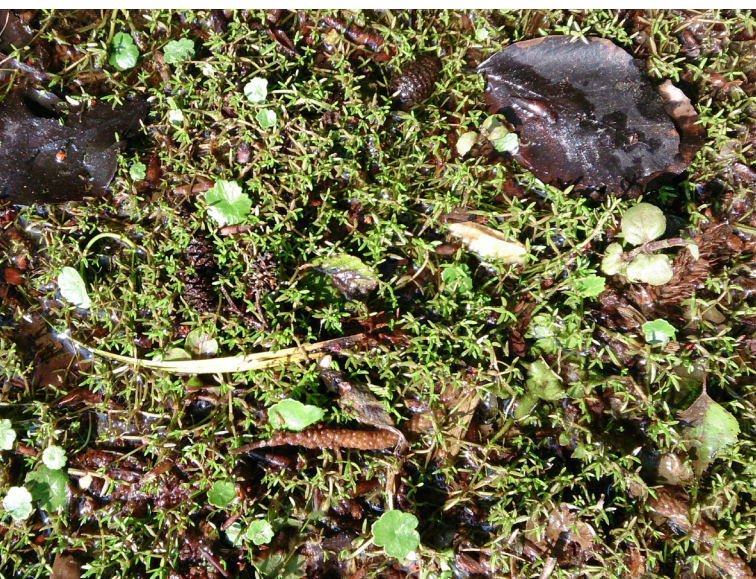
Abbildung 15: Nadelkraut ( Crassula helmsii ) und Wassernabel ( Hydrocotyle vulgaris ) im Uferbereich des Heidesees

2014 wurde zum einen das Hufeisenmoor untersucht und zum anderen der Magerrasen im Rahmen des landesweiten Biotopmonitorings kartiert.