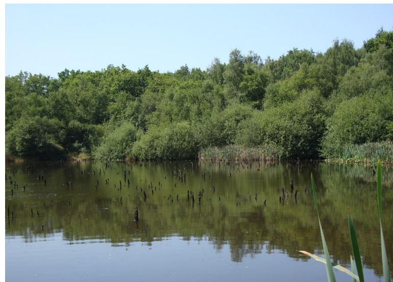
Abbildung 9: Die Bergsenkung im Köllnischen Wald wurde intensiv floristisch untersucht.

Vegetationsaufnahmen aus diesem Bereich wurden im letztjährigen Bericht dargestellt (Keil et al. 2014).