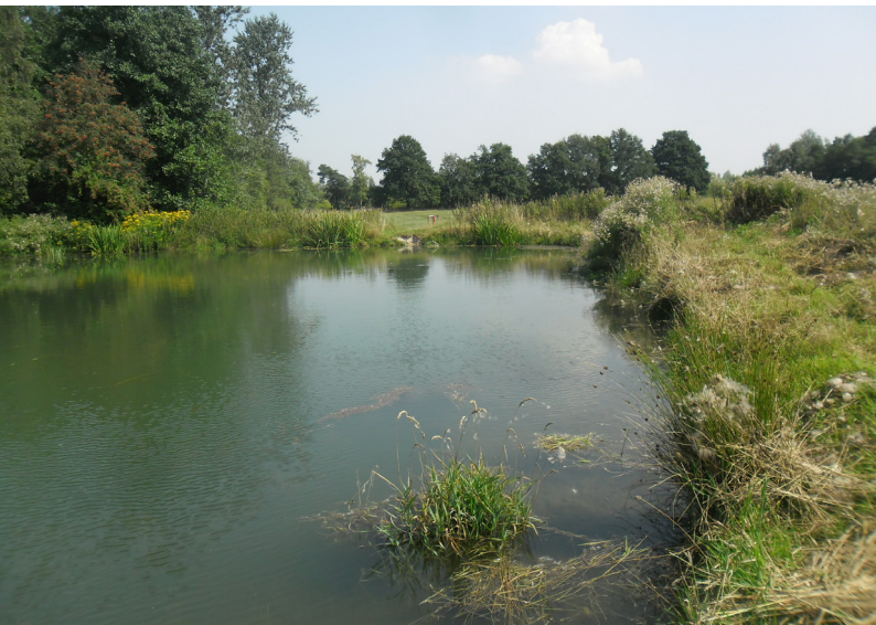
Abbildung 22: Das Gewässer 60.21.07 im Jahr 2013