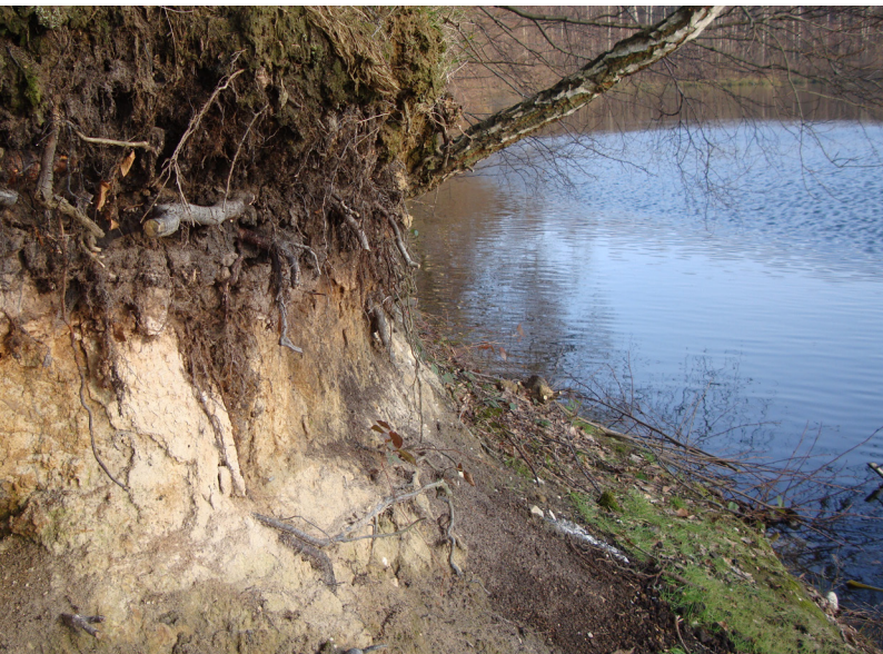
Abbildung 17: Für den Eisvogel freigelegtes Steilufer am Heide-see (29.01.)