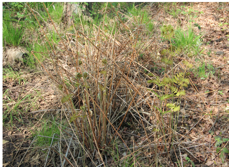
Abbildung 20: Wedelrichter des Königsfarns im Torfvenn

Bis auf die Feuchtgrünlandflächen zum Schwarzen Bach hin, befindet sich das Grünland insgesamt in einem unter naturschutzfachlichen Gesichtspunkten ungünstigen Erhaltungszustand. Es dominieren wenige Grasarten, während Beikräuter kaum zu finden sind.