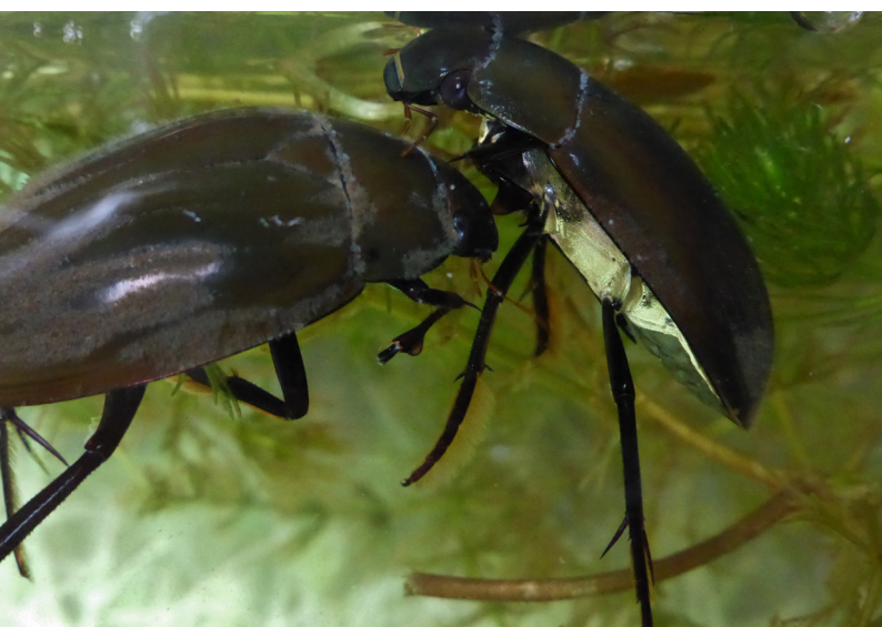
Abbildung 14: Überraschender Fund des Großen Kolbenwasserkäfers in den Gewässern am Haesterkampweg

Besonders bemerkenswert waren die Nachweise des Frühen Schilfjägers ( Brachytron pratense ), des Kleinen Blaupfeils ( Orthemtrum coerulescens ) und der Schwarzen Heidelibelle ( Sympetrum danae ), die wahrschein-