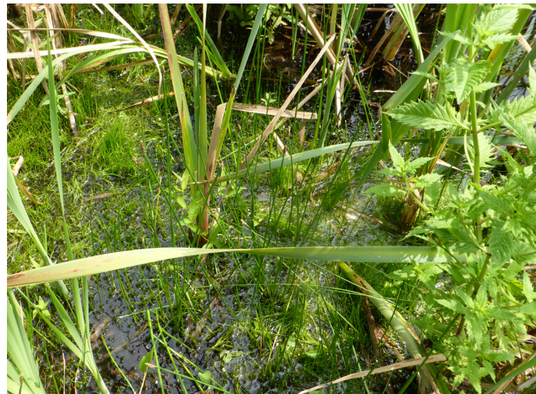
Abbildung 11: Kleiner Röhricht mit Pillenfarn am Kletterpoth

Da Moorfrosche 2012 im nördlicheren Gewässer am Haesterkampweg gefunden wurden, wurden diese Gewässer (Abbildung 12) sowie der benachbarte Heidhofsee wiederum besonders in den Fokus genommen. Am 01.03. konnten ausschließlich Grasfrösche ( Rana temporaria ) verhört werden, die Laichballen im