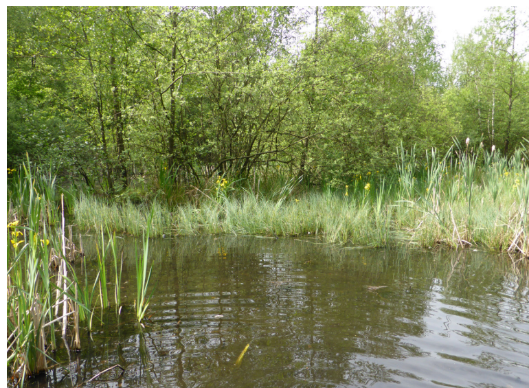
Abbildung 12: Untersuchtes Gewässer am Haesterkampweg.

Beide Gewässer wurden nacheinander mit Hilfe von Reusenfallen beprobt (Abbildung 13). Eingesetzt wurden 93 bzw. 89 Flaschenreusen und 34 bzw. 30 Eimerreusen. Die Untersuchungsintensität war somit sehr groß.