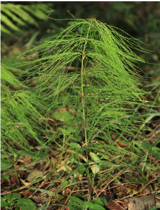
Abbildung 8: Wald-Schachtelalm in der Aue des Spechtbaches im FFH-Gebiet Köllnischer Wald.

Im Teil des Köllnischen Waldes, der als FFH-Gebiet ausgewiesen ist, wurden mehrere weitere Wuchsorte des Mehrjährigen Bingelkrautes ( Mercurialis perennis , RL BRG 3) kartiert. Wie in vergangenen Jahresberichten geschildert, ist dies eine Charakterart der basenreichen Buchen- und Eichen-Hainbuchen Wälder, die