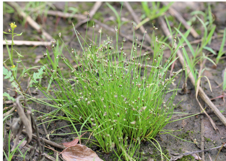
Abbildung 25: Die Borstige Schuppensimse ist eine seltene Pionierart auf offenen Schlammflächen von Gewässern.

lich ist. Durch eine weitere Vernässung könnten das ökologische Potential der Fläche optimiert und einige seltenere Feuchtezeiger, wie der Teich-Schachtelhalm ( Equisetum fluviatile ), gefördert werden.