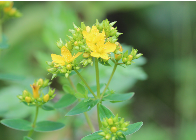
Abbildung 26: Das Geflügelte Johanniskraut am Brabecker Mühlenbach