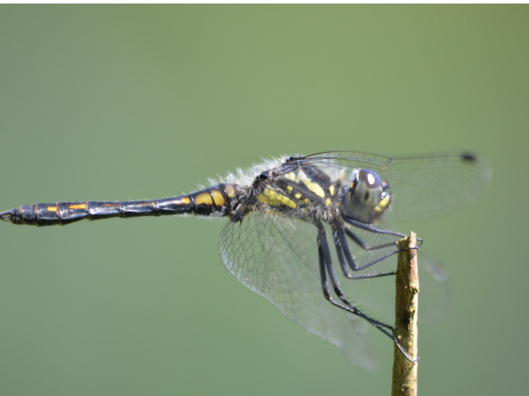
Abbildung 10: Schwarze Heidelibelle ( Sympetrum danae ) an der Bergsenkung im Köllnischen Wald

Diese Bergsenkung ist ein gutes Beispiel für den Wert anthropogener Feuchtbiotope im Ruhrgebiet. Rund um das Gewässer ist ein wertvoller Bruchwald mit einigen seltenen Pflanzenarten entstanden.