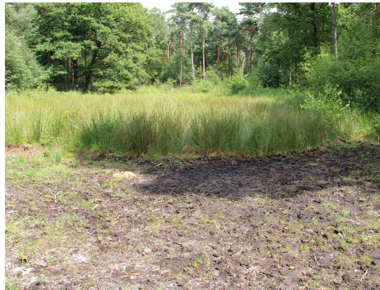
Abbildung 18: Abgeschobene Moorfläche mit Dauermonitoringfläche im Vergleich zur Moorfläche ohne Maßnahme

Im Hufeisenmoor wurde eine Vegetationsaufnahme auf der bereits bestehenden Dauermonitoringfläche erhoben, die im Winter 2011/2012 abgeschoben worden war. Im vergangenen Winter wurde ein weiteres Teilstück des Moores abgeschoben, wo nun eine zweite Dauermonitoringfläche eingerichtet wurde (Abbildung 18). Das Abschieben ist eine wichtige Maßnahme für den Natur- und Artenschutz, da es den Aufwuchs von Gehölzen und Nährstoffzeigern unterbindet und somit die typische Pioniervegetation nährstoffarmer Gewässer fördert.