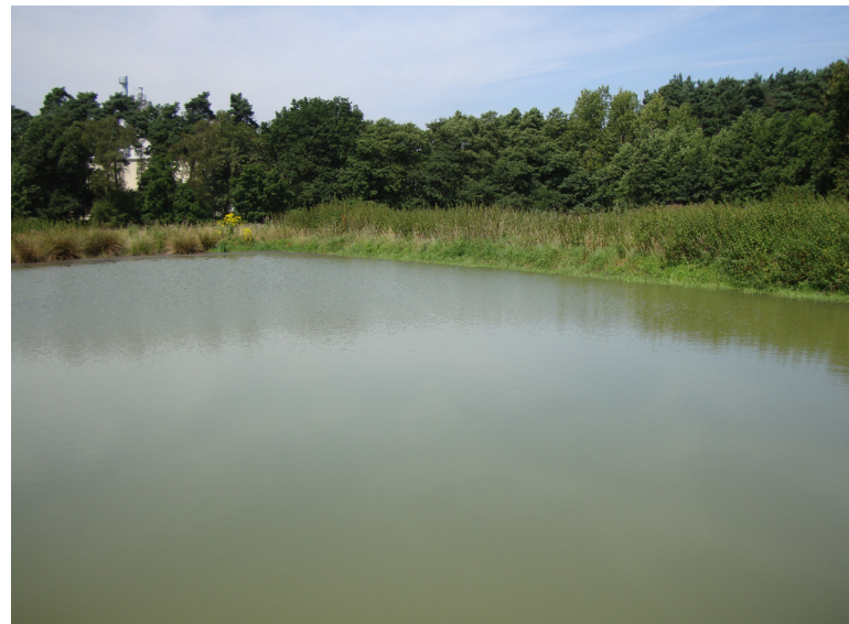
Abbildung 23: Das selbe Gewässer im Jahr 2014 nach intensiver Mahd der Ufer

ris cimicoides ), Wasserskorpione ( Nepa rubra ) und die Quellblasenschnecke ( Physa fontinalis ) nachweisbar. Bemerkenswerte und seltene Arten sind vor allem der Feuchtkäfer ( Hygrobia tarda ), die Stabwanze ( Ranatra linearis ) und der Zwergrückenschwimmer ( Plea leachi ).