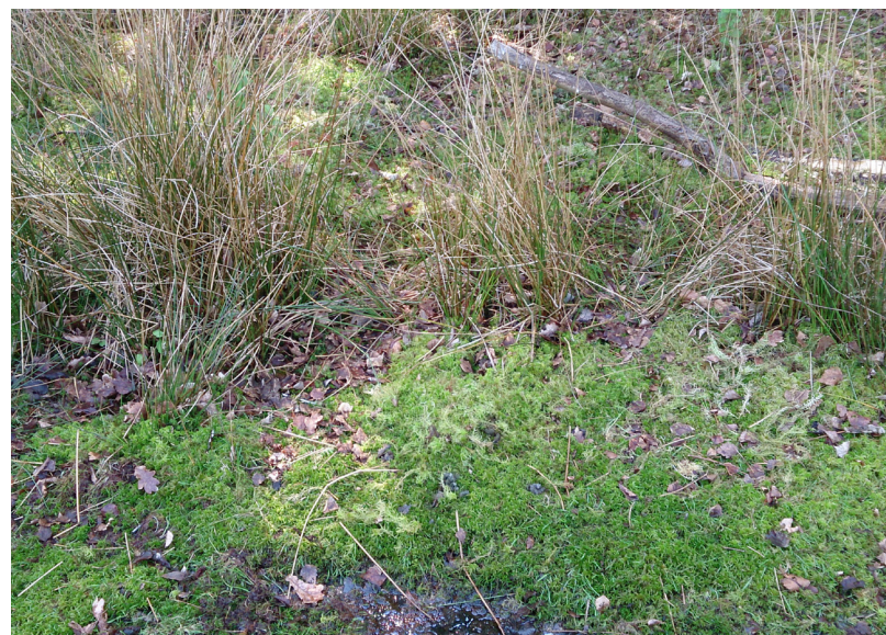
Abbildung 16: Torfmoosvorkommen am Heideseeufer mit Sphagnum fimbriatum