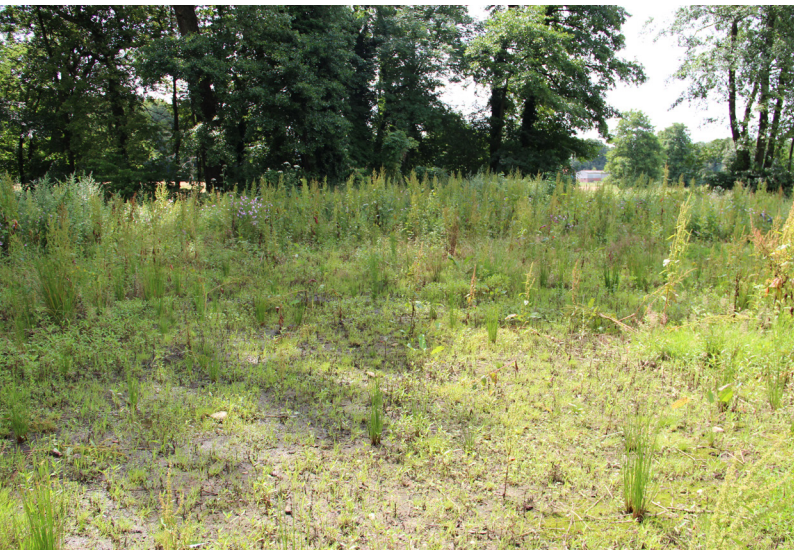
Abbildung 24: Die Blänke am Brabecker Mühlenbach war zum Untersuchungszeitpunkt ausgetrocknet.