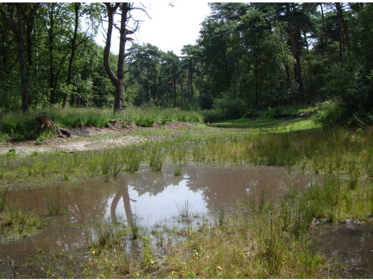
Abbildung 19: Niedriger Wasserstand im südlichen Abschnitt im Postwegmoor

gehung fiel auf, dass die Wasserstände sehr niedrig waren. Der kleinere nördliche Komplex war fast ausgetrocknet und es war lediglich noch eine wassergefüllte Wildschweinsuhle vorhanden. Auch das südliche größere Gewässer führte nur wenig Wasser (Abbildung 19). Am zweiten und dritten Termin war auch die Wildschweinsuhle komplett trocken und das größere Gewässer war stets von akuter Austrocknung bedroht.