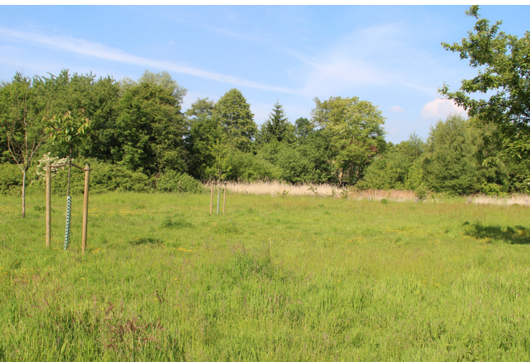
Abbildung 27: Überblick über die Ausgleichsfläche „Winkelsheide“

Das Gebiet Winkelsheide (Abbildung 27) wurde im Berichtszeitraum erstmals durch die BSWR untersucht.