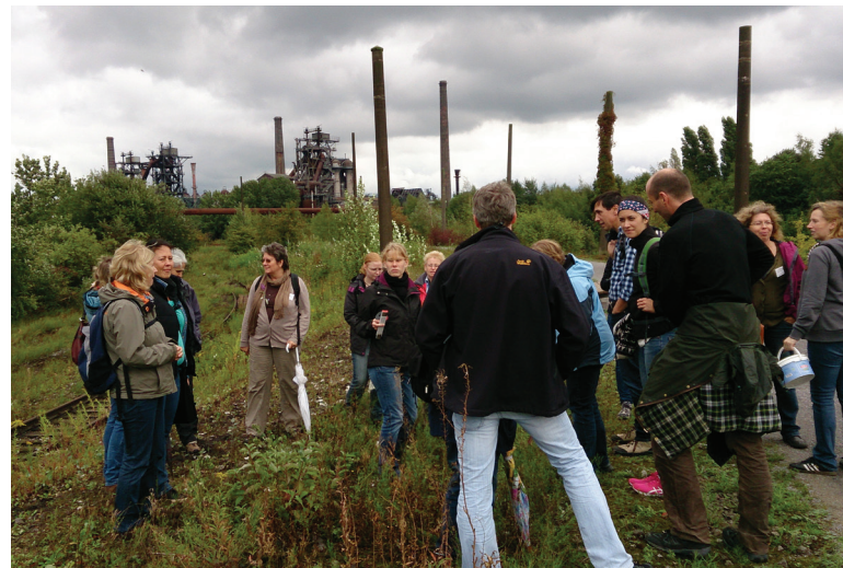
Abbildung 143: Die Teilnehmer der Multiplikatorenfortbildung untersuchten Flora und Vegetation im Landschaftspark Duisburg-Nord

Am 14. September 2013 fand die erste Multiplikatorenfortbildung zur Umweltbildung auf Industriebrachen in der Dependance im Landschaftspark Duisburg-Nord statt, die vom Regionalverband Ruhr sowie der Biologischen Station und der Natur- und Umweltschutz-Akademie veranstaltet wurde. Sie richtete sich u. a. an Lehrer/innen, Erzieher/innen, Naturguides, Exkursionsleiter/innen und Jugendgruppenleiter/innen, die dazu motiviert und befähigt werden sollten, Industriebrachen als Ort von Umweltbildung fachkompetent zu nutzen.