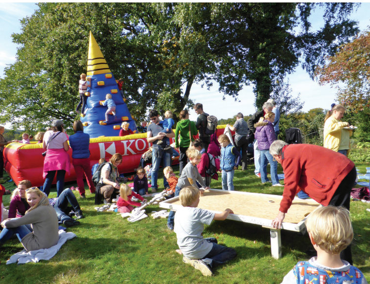
Abbildung 147: Hüpfburg und Spielmobil boten den Kindern viel Abwechslung und Vergnügen