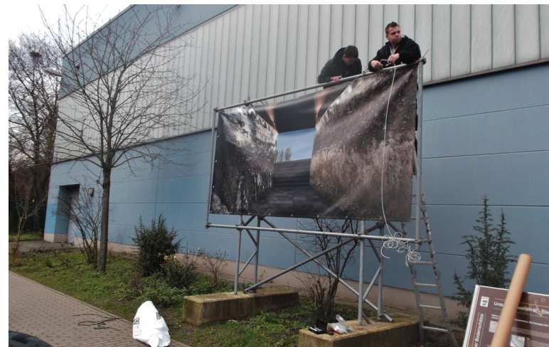
Abbildung 139: Neuanbringung des Plakates an der Sporthalle Harbecke nach einem Verlust durch Diebstahl

Auch 2013 gab es wieder große Probleme mit Vandalismus-Schäden. So mussten die Schatztruhen am