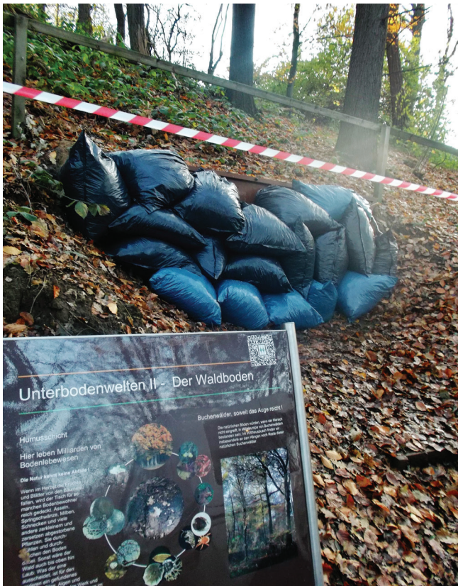
Abbildung 140: Wintersicherung der Bodenroute

Wasserbahnhof sowie die Hörstation auf der Mendener Höhe aufgrund mutwilliger Zerstörung komplett ersetzt werden. Das große Plakat an der Sporthalle Harbecke fiel einem Diebstahl zum Opfer und wurde ebenfalls ersetzt (Abbildung 139 auf Seite 105). Darüber hinaus wurden regelmäßig Schmierereien auf den Schildern entfernt und frostanfällige Stationen für den Winter gesichert (Abbildung 140).