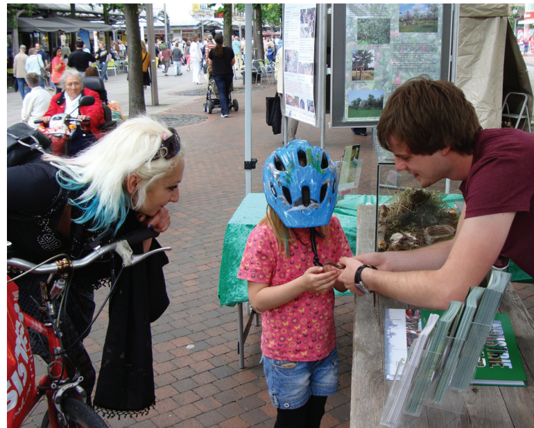
Abbildung 145: Ein Kind lernt auf dem Duisburger Umweltmarkt eine Blindschleiche kennen

Am 22.06. fand im Rahmen der Duisburger Umwelttage in der Fußgängerzone der Umweltmarkt statt, auf dem die BSWR traditionell wieder mit einem Informationsstand vertreten war. Zwischen 10:00 Uhr und 18:00 Uhr konnten rund 600 Besucher am Stand gezählt werden, die sich über die Arbeit der Biologischen Station informierten und vor allem von den heimlichen Stars des Umweltmarktes angezogen wurden. Denn vier Blindschleichen leisteten Öffentlichkeitsarbeit an der Basis und sorgten sowohl bei den ganz kleinen und jungen als auch bei den etwas größeren und älteren Besuchern für strahlende Augen (Abbildung 145). Die