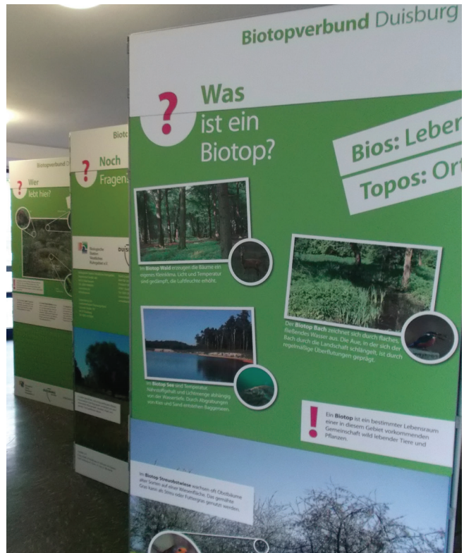
Abbildung 150: Die Biotopverbund-Ausstellung Duisburg im Bezirksamt

Die Ausstellungswände zum Biotopverbund in Duisburg waren über das Jahr verteilt an unterschiedlichen öffentlichen Orten im Stadtgebiet aufgestellt. So war die Ausstellung lange Zeit im Zoo Duisburg aber auch in den Bezirksämtern Walsum und Duisburg Süd zu sehen.