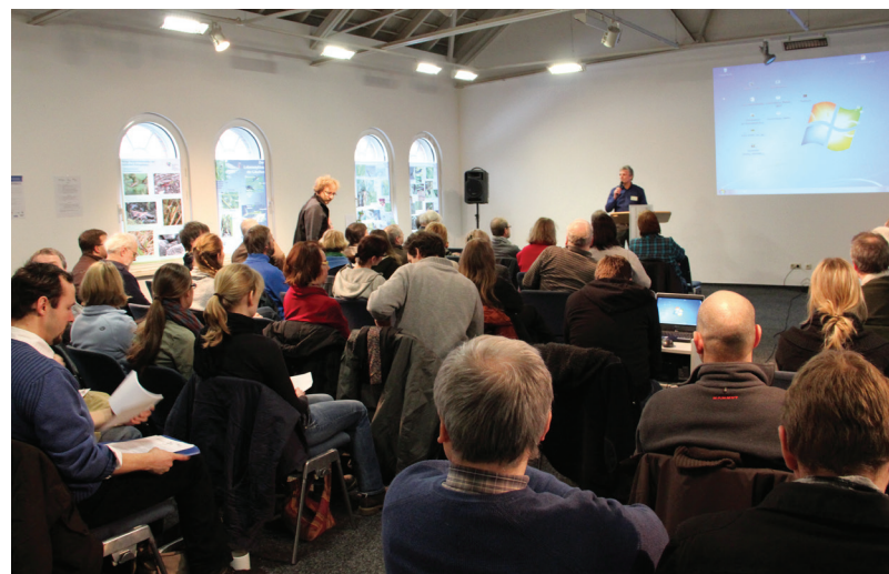
Abbildung 141: Der Flora-Fauna-Tag war auch 2013 wieder gut besucht

Es findet mittlerweile national wie international vermehrt Aufmerksamkeit, sodass sich im April 2012 ein Arbeitskreis „Netzwerk Urbane Biodiversität – Ruhrgebiet“ formierte. Ihm gehören u. a. Vertreter des Regionalverbandes Ruhr (RVR), der Emschergenossen-