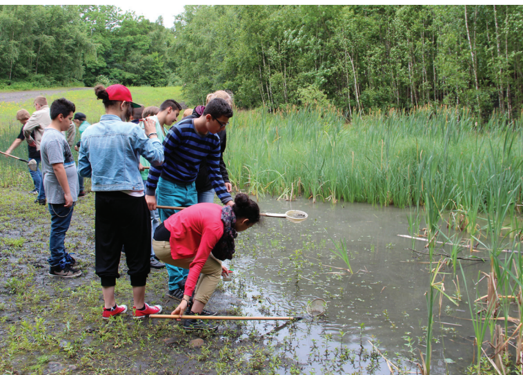
Abbildung 136: Gewässeruntersuchung beim Tag der Artenvielfalt auf Zeche Zollverein

Im Erprobungsjahr 2013 nahmen bereits elf Klassen mit 236 Schülerinnen und Schülern an dem Projekt teil