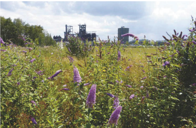
Abbildung 142: Neophyten wie der Schmetterlingsstrauch ( Buddleja davidii ) waren Diskussionsstoff auf der Tagung „Urbane Biodiversität“

schaft, der Universitäten Duisburg-Essen und Bochum und Mitarbeiter der BSWR an.