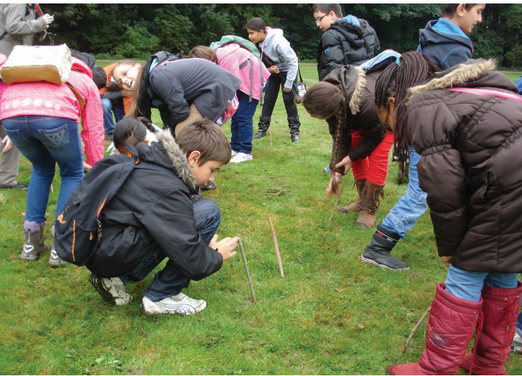
Abbildung 135: Auf der Suche nach Regenwürmern im Grünen Klassenzimmer

Wild- und Nutztiere (vgl. Abbildung 134 auf Seite 103, Abbildung 135) unterschiedlicher Lebensräume und Nischen (Wasser, Wald, Bauernhof, Boden, Laub) vorgestellt und in Kleingruppen von den Schülerinnen und Schülern selbstständig erforscht. Neben der Untersuchung von Tieren ist auch im Grünen Klassenzimmer das Naturerlebnis für die Kinder ein wichtiger Baustein. Viele der in strukturschwachen Stadtteilen aufwachsenden Kinder sind auf dieser Exkursion zum ersten Mal in ihrem Leben im Wald, sodass das Spielen und Toben in ausgewählten Waldbereichen durchaus gewollt und wichtig ist.