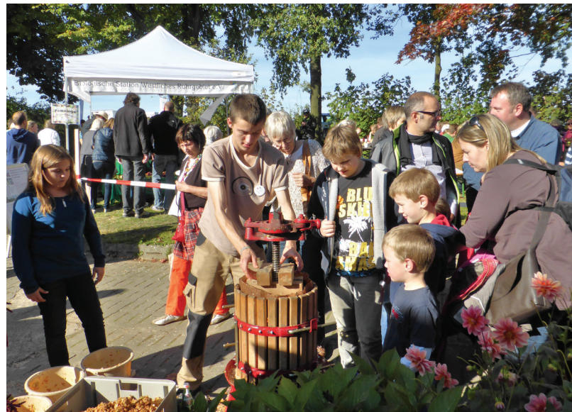
Abbildung 149: Apfelsaft wurde aus Äpfeln der Region für die Besucher frisch gepresst