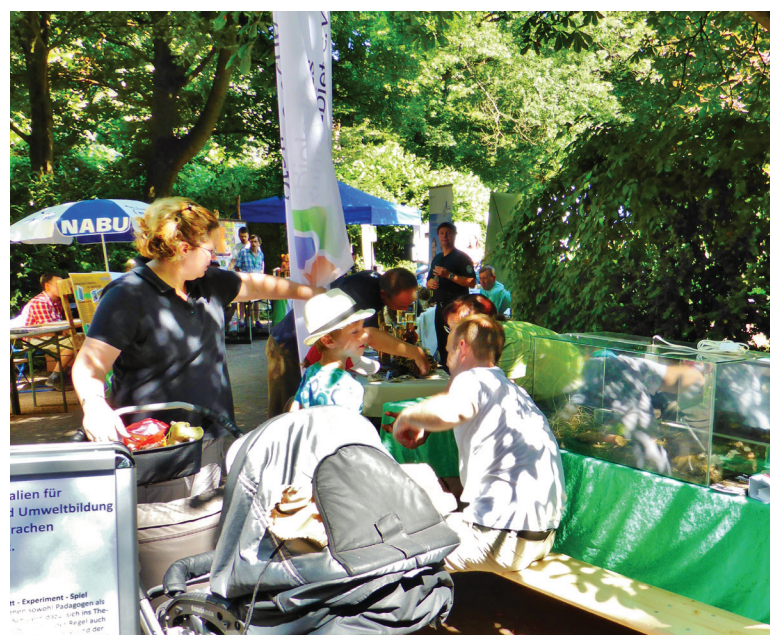
Abbildung 146: Schönstes Wetter lockte die Besucher des Artenschutztages in den Duisburger Zoo. Nicht nur die Kinder waren von den Blindschleichen fasziniert

Der traditionelle Artenschutztag im Zoo Duisburg wurde auch 2013 wieder von der BSWR mitgestaltet. An ihrem Stand wurden interessierte Besucher insbesondere über Biologie, Schutz und Vorkommen von Blindschleichen und Schlangen informiert (Abbildung 146).