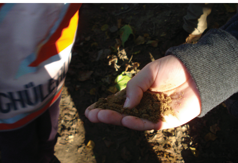
Abbildung 133: Bodenbestimmung im Bodenklassenzimmer

Im Zuge des Ausbaus des Witthausbusch mit seinem Tiergehege und seiner Infrastruktur (barrierefreie sanitäre Anlagen, Seminarraum) zu einem Umweltbildungszentrum wurde 2013 erstmals das Grüne Klassenzimmer durch die BSWR angeboten. Beim Grünen Klassenzimmer handelt es sich, ähnlich wie beim Bodenklassenzimmer, um eine halbtägige Exkursion für Klassen der 2. bis 7. Jahrgangsstufe über Kahlenberg, Witthausbusch und Mendener Höhe hinunter zur Ruhr, die mit einer Fahrt mit der Weißen Flotte zum Wasserbahnhof endet. Auf der Wanderung werden heimische