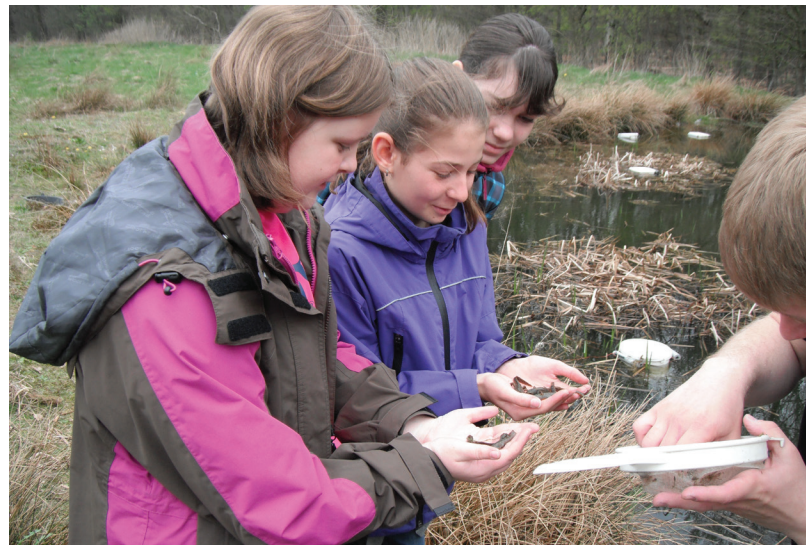
Abbildung 137: Die Teilnehmerinnen beim Girls Day untersuchen Molche aus Reusenfallen

und auch für 2014 haben sich bereits einige Klassen angemeldet.