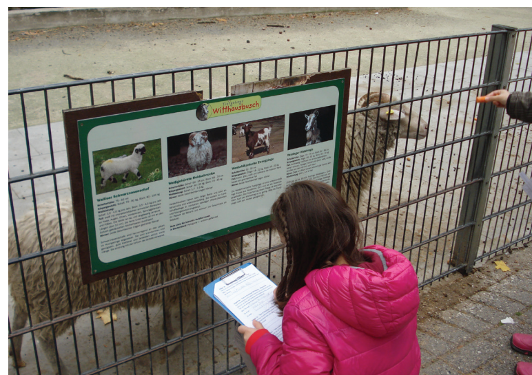
Abbildung 134: Das Grüne Klassenzimmer macht im Tiergehege im Witthausbusch Halt