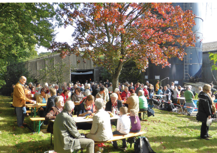
Abbildung 148: Das Apfelfest war 2013 außergewöhnlich gut besucht