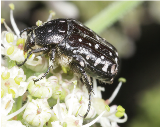
Abbildung 159: Trauer-Rosenkäfer auf Wiesen-Bärenklau

Trauer-Rosenkäfer ( Oxythyrea funesta ): 1 Ex. 29.7.; OB Dieckerstraße, neben der Gartenterrasse an blühendem Heracleum sphondylium ; B. Jacobi