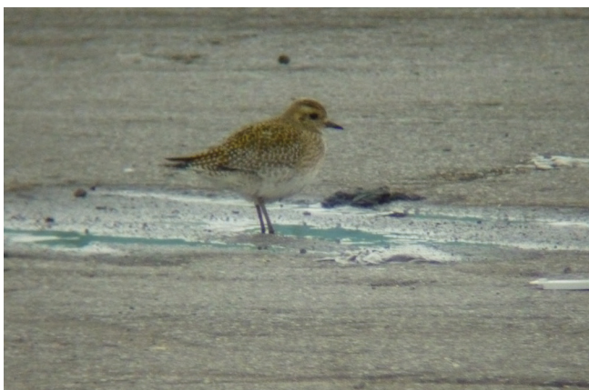
Abbildung 163: Goldregenpfeifer auf der Brache Neue Mitte in Oberhausen

Goldregenpfeifer: 1 Ex. 11.3.; OB Neue Mitte; J. Sattler (Abbildung 163) | 1 Ex. 15.3.; DU-Fahrn; Rheinaue Binsheim nördl. Woltershofer Str., unter Kiebitzen; P. Kretz | 1 Ex. 18.3.; DU-Binsheim/Rheinvorland; flach überfliegend nach NE; wohl erst kurz vorher in der Nähe aufgefliegen; T. Rautenberg | 4 Ex. 7.4.; MH-Saarner Mark/Wambachniederung; nachts ziehend, rufend; J. Tupay | 5 Ex. 8.4.; DU Binsheimer Feld; auf Acker, wurden permanent verschleucht von revierhaltentem Kiebitz; K. Koffijberg