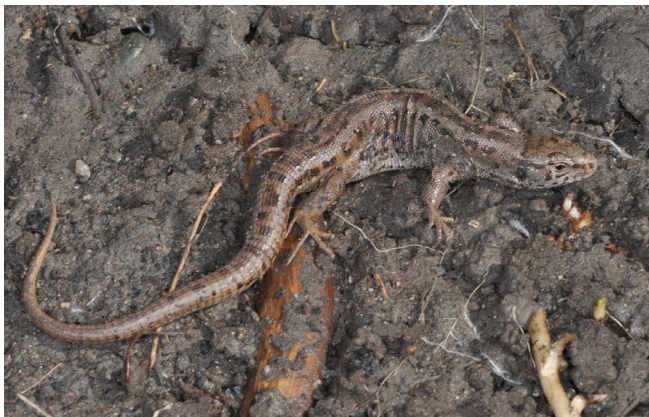
Abbildung 162: Weibliche Zauneidechse aus Duisburg-Baerl

Zauneidechse: 1 Ad. 19.6.; DU Wedau, Dirschauer Weg 43, unterhalb 2. Balkon von Norden aus; die Echse wurde an mehreren Tagen beobachtet, vermutlich ein Weibchen; K.-E. Pikelj | 2 Ad. 20.8.; DU Brachfläche nahe Baerl; die Tiere versteckten sich unter abgelegten Brettern; beides Weibchen; P. Janzen (Abbildung 162)