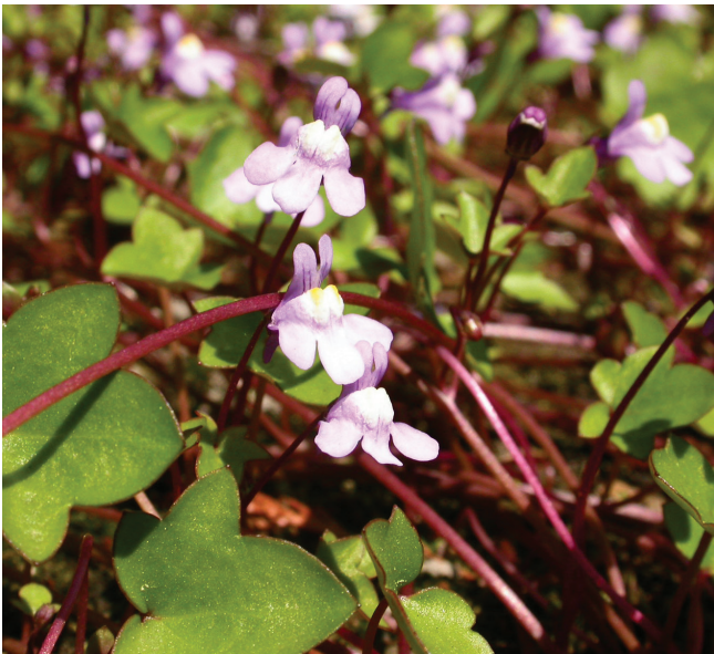
Abbildung 157: Blühendes Zimbelkraut ( Cymbalaria muralis )

Zimbelkraut ( Cymbalaria muralis ): >20 Ex. 1.4.; BO Kemnader Staasee; entlang einer Mauer; J. Sattler | 1 Ex. 21.5.; OB Brache Neue Mitte, an der Brücke der Ripshorster Straße; blühend; weiterhin ein Exemplar von Asplenium ruta-muraria vorhanden; J. Sattler