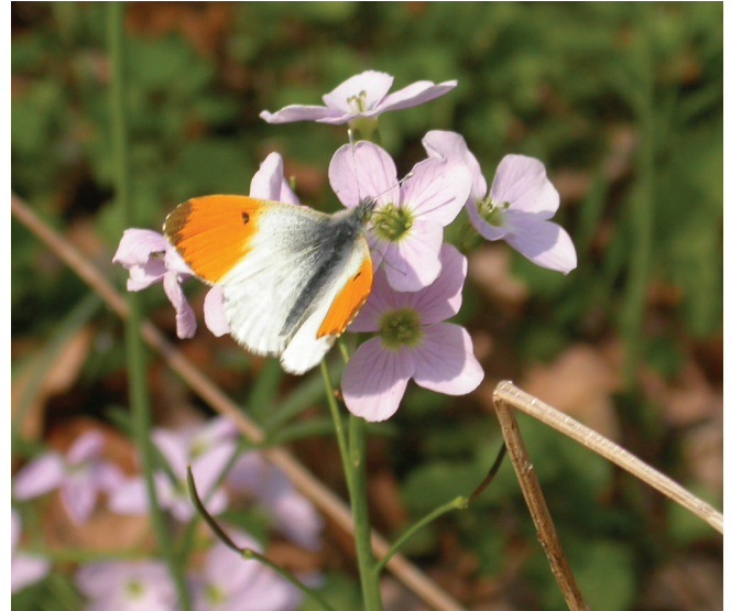
Abbildung 158: Männlicher Aurorafalter ( Anthocharis cardamines ) an Wiesen-Schaumkraut

Aurorafalter ( Anthocharis cardamines ): 1,0 Ex. 17.4.; OB Gehölzgarten Ripshorst; J. Sattler