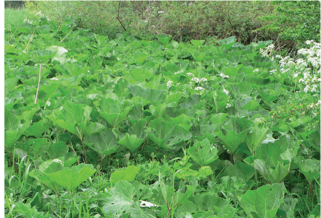
Abbildung 154: Die Gewöhnliche Pestwurz ( Petasites hybridus ) fällt insbesondere durch ihre großen Blätter auf

Gewöhnliche Pestwurz ( Petasites hybridus ): >1000 Ex. 10.8.; MH Ruhrufer; P. Keil