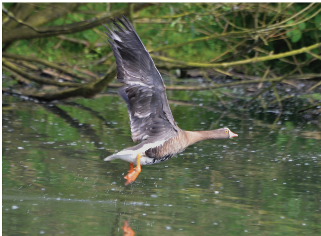
Abbildung 165: Eine Zwerggans hielt sich 2013 im Mülheimer Ruhrtal auf

Zwerggans: 1,0 Ex., unberingt, mehrfach beobachtet von 13.1. bis 23.11.; MH Ruhr: Dicken am Damm-Haus Kron; 13.1. verges. mit Kanadagänsen, Graugänsen und einer Weißwangengans; M. Schott, F. Wächtershäuser u. a. | selbes Ind. 29.1.; MH „Blänke“ Mendener Str; verges. mit Kanadagänsen u. Graugänsen; P. Kretz | 23.2.; MH Ruhr: zw. Flora-Wehr u. Mendener Brücke; gemeinsam mit Stockenten an Fütterungsstelle; P. Kretz | zw. 3.2. u. 26.12.; MH „Kellermanns Loch“ Saarn-Mendener-Ruhraue; 3.2.: hielt sich alleine auf dem Gewässer auf, sehr geringe Fluchtdistanz, flog dann auf zu „weidenden“ Kanadagänsen auf der westl. angrenzenden Wiese; 4.2. äsend mit Kanadagänsen, Nilgänsen u. Graugänsen, wachsamer als Kanadagänse; 5.2. nach wie vor in dem Trupp aus Kanadagänsen; Vogel ist sehr wachsam und sichert mehr als die Kanadagänse; 6.2. unter Kanadagänsen nahrungs-