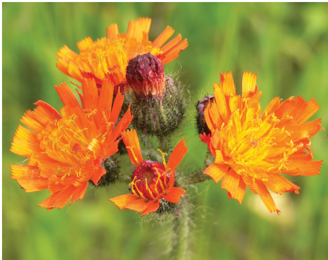
Abbildung 156: Das Orangerote Habichtskraut ( Hieracium au- rantiacum ) in Oberhausen

Orangerotes Habichtskraut ( Hieracium aurantiacum ): eini- ge m 2 2.7.; OB Brache Neue Mitte; J. Sattler