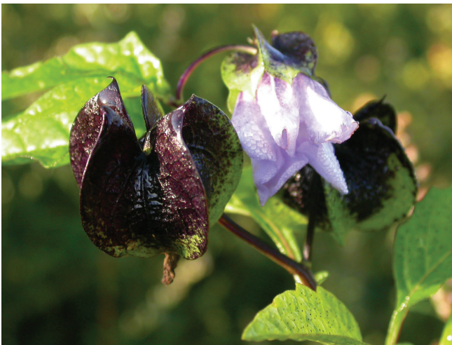
Abbildung 155: Die Giftbeere ( Nicandra physalodes ) stammt ursprünglich aus Südamerika und ist in Deutschland verwildert

der Ostseite der A 59 im Landschaftspark DU-Nord; Status unklar; W. Kahlert