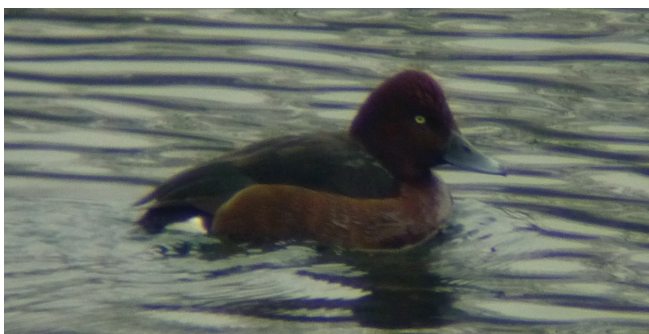
Abbildung 164: Moorente auf dem Toeppersee

Moorente: 1,0 Ex. 28.3.; DU Toeppersee; zusammen mit Reiherenten; J. Sattler