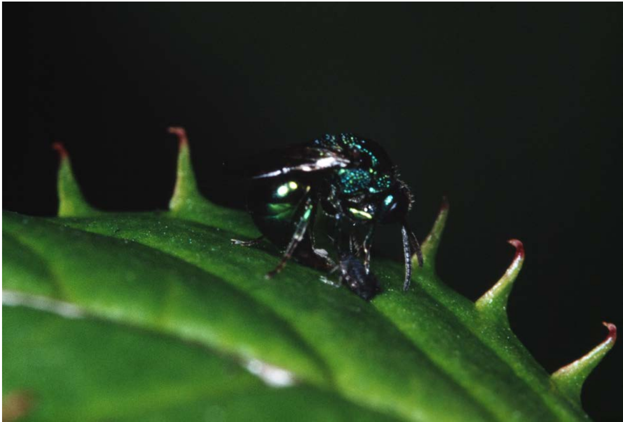
Abb. 1: Die nicht bestimmte Goldwespe (Elampini) vom 09.09.2000 in Eiablagehaltung an einer Blattlaus auf Drüsigem Springkraut Impatiens glandulifera.