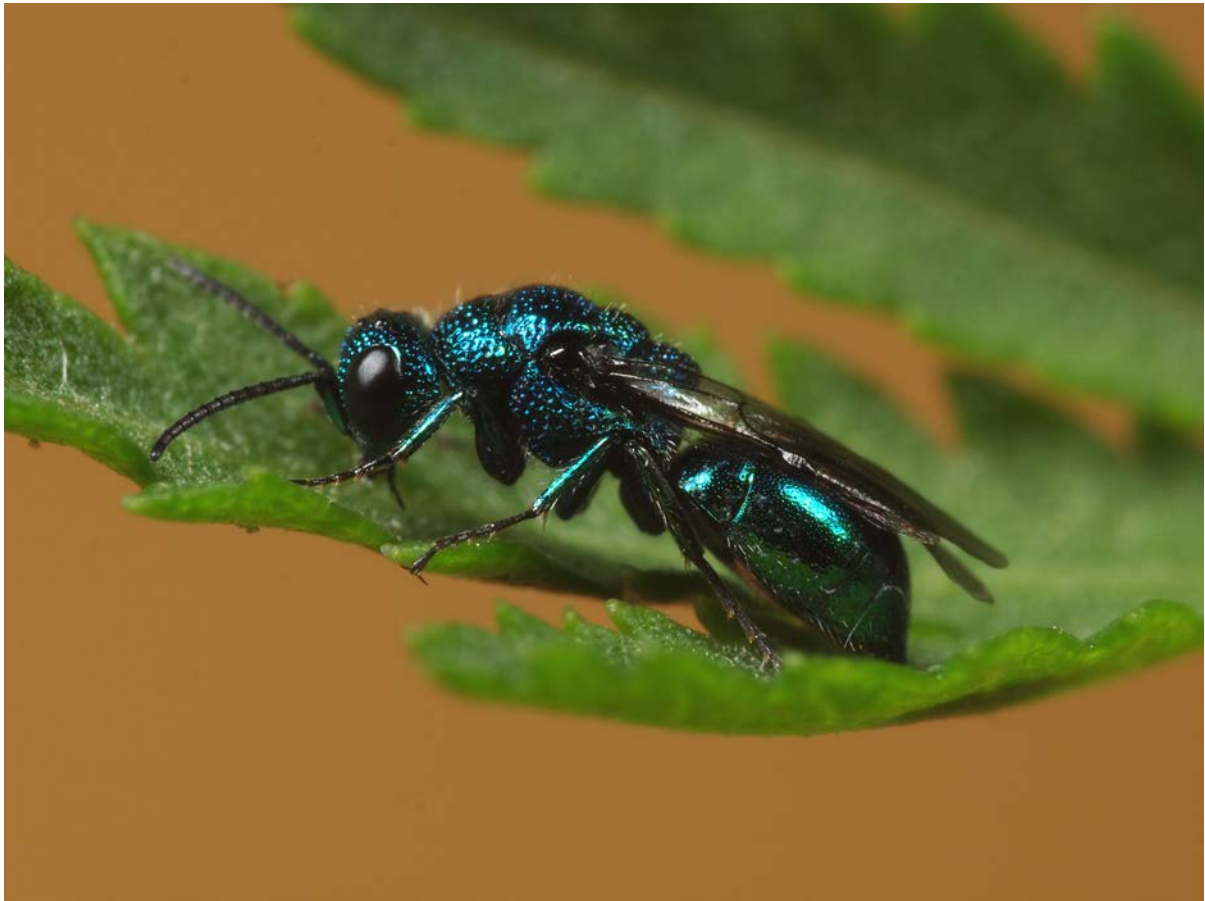
Abb. 3: Das am 04.07.2021 gefundene Weibchen von Philoctetes truncatus.