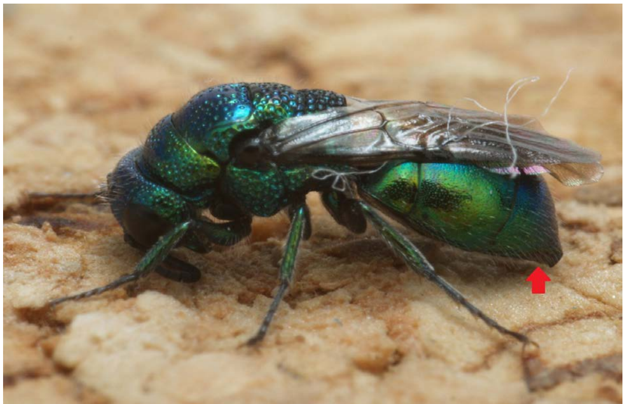
Abb. 2: Eines der beiden am 27.10.2010 gefundenen Weibchen von Philoctetes truncatus. Zur Aufnahme wurde das Tier gekühlt. Der hornfarbene letzte Abschnitt des 3. Tergits und der linke Zahn an demselben sind zu erkennen.